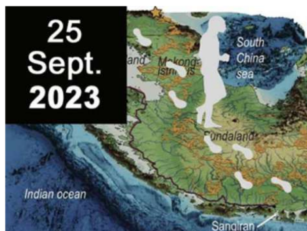
Atelier préparatoire en 2023